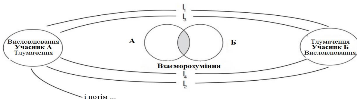
Рис. 2. Конвергентна модель екологічної комунікації [Flor, с. 24]

Це лінійна модель екологічної комунікації. На думку О. Флора, до лінійних моделей варто ставитися обережно, оскільки базуються на механістичному поясненні явища [16]. Лінійна модель віддає ініціативу комунікації уряду та відводить другорядну роль його виборцям. Натомість він підтримує конвергентну модель екологічної комунікації, що подає комунікацію як циклічну й інтерактивну, де однаково важливі і повідомлення, і зворотний зв'язок, де суб'єкт (комунікатор) й адресат як учасники процесу спілкування співрівні, а основною метою або функцією комунікаційного процесу є взаєморозуміння. На нашу думку, конвергентна модель коректніша, вона відображає особливості екологічної комунікації.